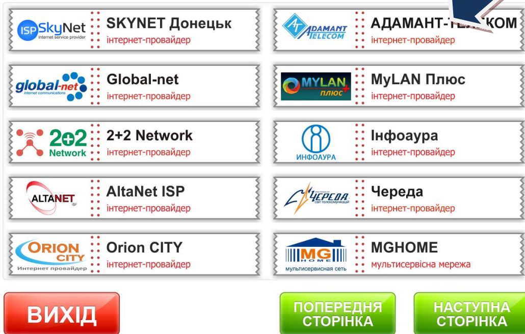
Рисунок 2. Выбор услуги в меню "Интернет провайдеры"