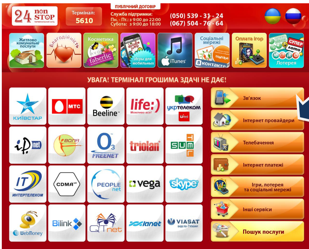
Рисунок 1. Выбор услуги на главном экране